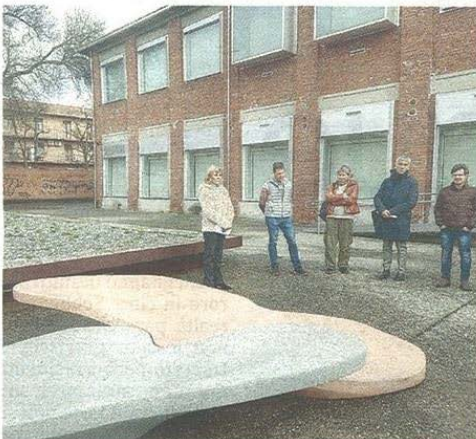
Sindaco e progettisti mostrano le strutture della piazza lineare